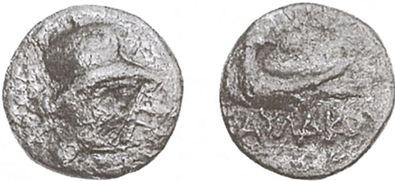
Рис. 2. Гипотетическая монета Савлака